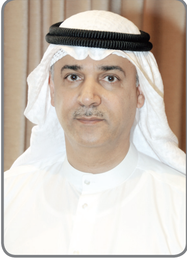
الأمين العام للمجلس الوطني للثقافة والفنون والآداب م. علي اليوحة