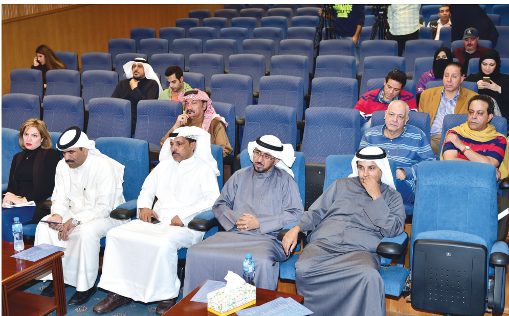
جانب من الإعلاميين وحضور المؤتمر

وتابع إنه بعد ليلة الافتتاح، والتي ستشهد تكريم الرواد، سوف تقدم جميع العروض على مسرح الدسمة، في السابعة والنصف مساءً، مزيحا الستار عن عروض المهرجان، وهي «على المتضرر اللجوء إلى القضاء» لفرقة المرابا، «الجلادان» لفرقة المسرح العربي، «حقيبة ذكريات» لفرقة سينك للإنتاج المسرحي والفني. كما سيتم تخصيص يوم حلقة نقاشية بعنوان «تكاملية العلاقة بين المبدع