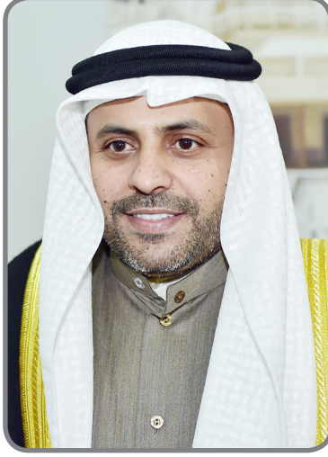
وزير الإعلام ووزير الدولة لشؤون الشباب ورئيس المجلس الوطني للثقافة والفنون والآداب محمد ناصر الجبري

العبيد ومحمد علي حسين ومحمد الفهيد ومريم الرقم. وتتنافس على جوائز المهرجان سبعة عروض مسرحية، هي مسرحيات «على المتضرر اللجوء إلى القضاء» لفرقة المرابا، «الجلادان» لفرقة المسرح العربي، «حقيقية ذكريات» لفرقة سينك للإنتاج المسرحي والفني. كما سيتم تخصيص يوم لحلقة نقاشية بعنوان «تكاملية العلاقة بين المبدع والناقد»، ثم عرض لمسرحية «درس» لمسرح الخليج العربي، «ميلاد غريب» لفرقة المسرح الكويتي، «دوغمائية» للفرقة المسرحية التابعة لهيئة التعليم التطبيقي و«وحش طوروس» لفرقة المسرح الشعبي، وستعرض المسرحيات تباعا على خشبة مسرح الدسمة، وستعقب كل عرض مسرحي ندوة فكرية