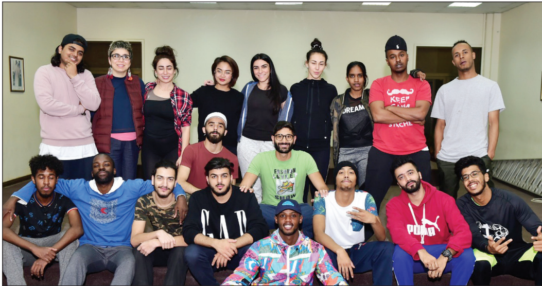
نجوم عرض الافتتاح في لقطة جماعية عقب البروفات