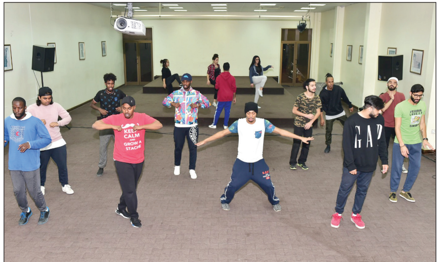
جانب من بروفة عرض الافتتاح في مسرح الدسمة